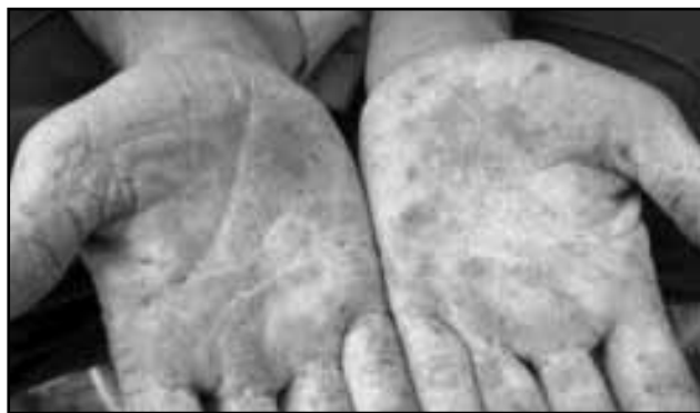
Figura 2. Hiperqueratosis palmar provocada por consumo de agua con arsénico.

Dado que las características organolépticas de las aguas arsenicales no son generalmente desagradables, es decir, no presentan color, olor o gusto particular, los individuos consumen el agua sin prestar atención a posibles efectos. Por ello, las consecuencias tóxicas pueden observarse tardíamente. El comienzo de los síntomas puede ocurrir recién entre los 5 y 10 años de exposición, y las lesiones malignizarse solamente décadas después. El tiempo que tarda en manifestarse el HACRE